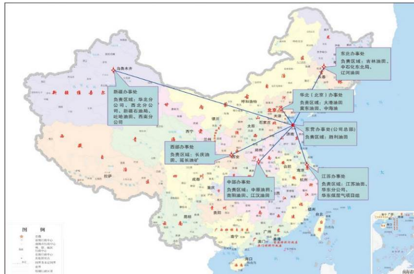
部分国内售后服务机构情况

目前，在国内建有，7个办事处，4个子公司（新疆两个），国际设有4子公司，售后服务覆盖全国大部分地区及国外中东、俄罗斯、南美、北美、加拿大等地区，如下图所示。在全国设置现场技术服务站，服务范围涵盖了国内绝大多数油气田单位，可快捷为用户解决问题、解决困难。